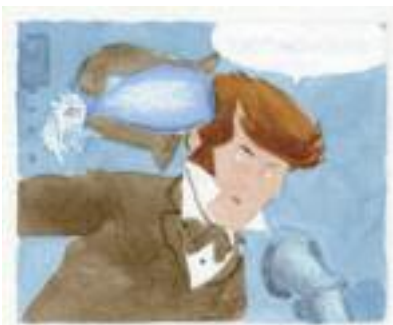
Dino Battaglia, I 5 su Marte , 1967 tavola retro-colorata