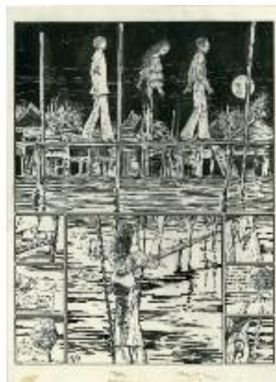
Guido Crepax, Emmanuelle , 1978