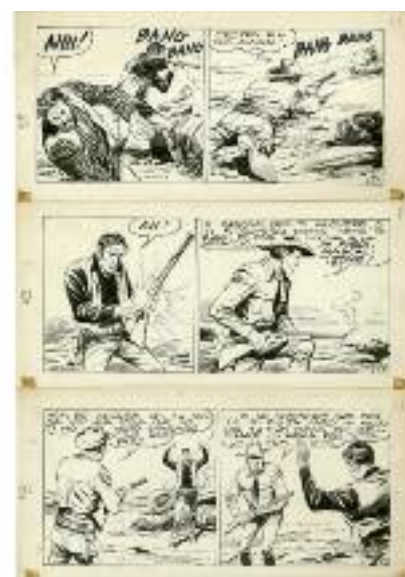
Aurelio Galeppini, Tex - Sangue su Laredo , 1963

1 tavola nascosta: editorial cartoon di McCay sul retro di Rarebit Fiend