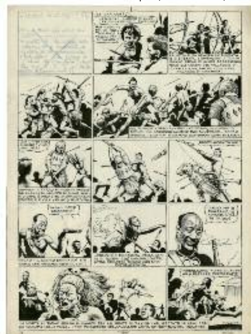
Franco Caprioli, L'isola Giovedì , 1940