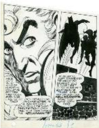
Neal Adams, Batman , 1968

Stampa a colori e b/n. Prezzo di copertina euro 25,00 scontato in mostra a euro 20,00.