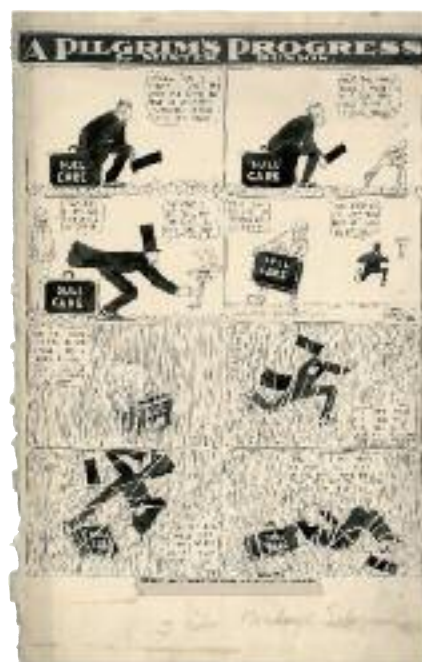
Winsor McCay, A Pilgrim's Progress , 1905

Il Centro svolge un ruolo importante nella diffusione del fumetto come cultura, ed è un punto di riferimento locale e nazionale. L'attività