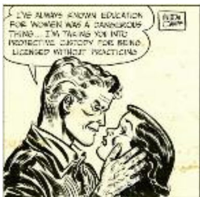
Milton Caniff, Steve Canyon , 1948

"I Love Fumetti" è una mostra evento che celebra il fumetto come passione, mezzo d'espressione, linguaggio artistico e intrattenimento intelligente. Si propongono tre diverse sezioni per rappresentare i tratti distintivi del Cfpaz e alcuni momenti straordinari della storia del fumetto mondiale.