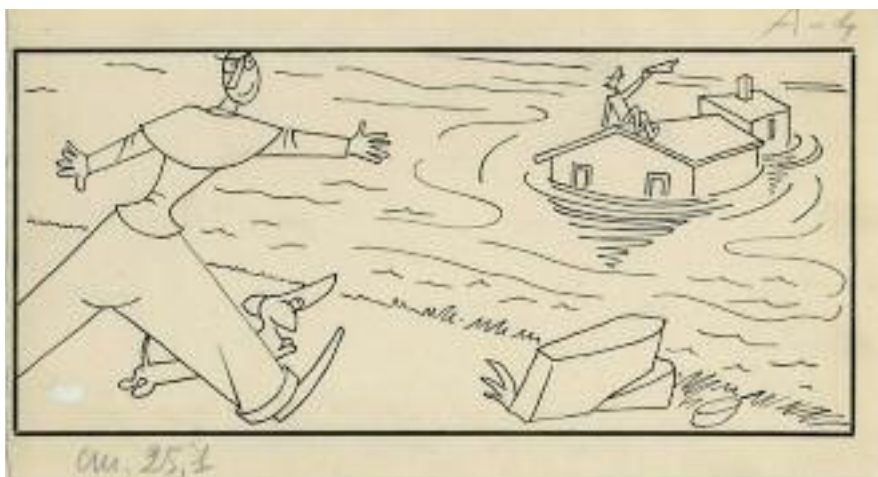
Sergio Tofano, Il signor Bonaventura , 1952