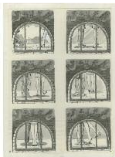
Will Eisner, Windows/Worm's Eye View , 1981