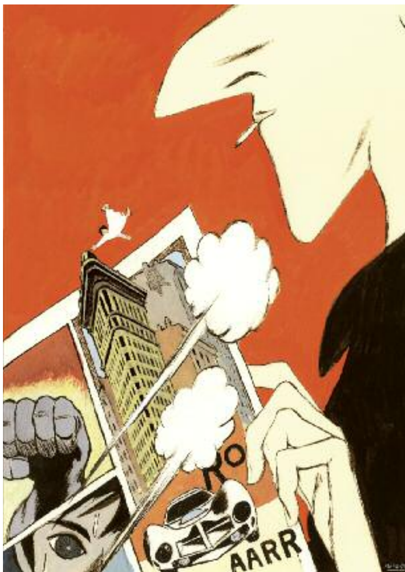
Illustrazione di Manuele Fior per la comunicazione della mostra