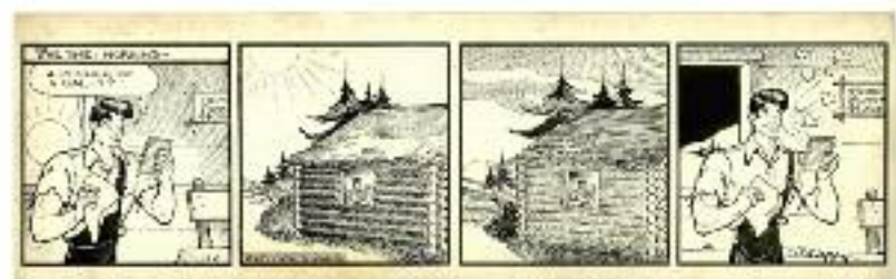
Al Capp, Lil' Abner , 1942