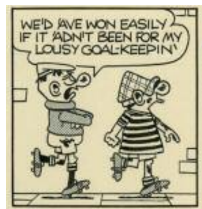
Reg Smythe, Andy Capp , 1981