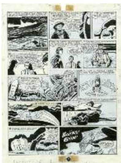
Hugo Pratt, L'ombra contro l'ammiraglio , 1965

I proprietari degli originali in mostra, da sempre sostenitori del Cfpaz, hanno costruito negli anni una collezione entusiasmante, con tavole