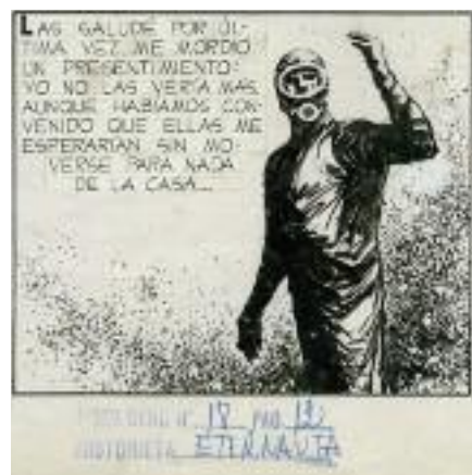
Francisco Solano Lopez, Eternauta , 1958

Riconoscendo il venticinquesimo anniversario dell'apertura del Centro, il numero 25 sarà una sorta di numero aureo di tutta l'esposizione che prevede tre sezioni: